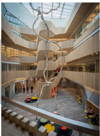
Hubben, Vasakronan