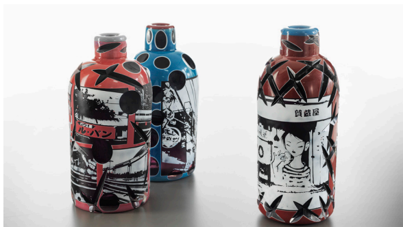
Sake, glasföremål av Olle Brozén